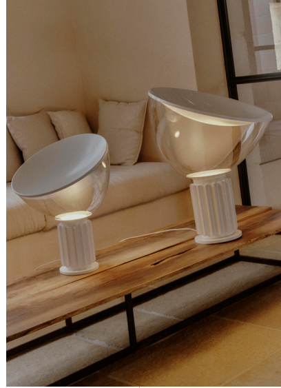
Flos 被认为是意大利设计中最具代表性的符号之一的Taccia台灯推出全新亚光白版本