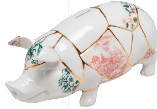
Seletti 小猪存钱罐将小猪形象与金缮工艺结合，造就令人耳目一新的趣味作品