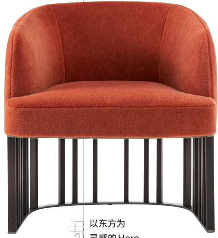
Gioggetti 以东方为灵感的Hero扶手椅