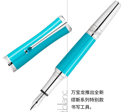
Montblanc 万宝龙推出全新缪斯系列特别款书写工具，致敬永远的歌剧女神——玛丽亚·卡拉斯 (Maria Callas)