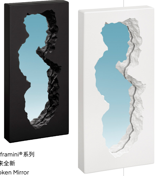
Gufram Guframini®系列带来全新Broken Mirror迷你版本