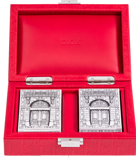
Dior Maison Dior Maison推出两款限定纸牌礼盒，致敬游戏艺术，纸牌牌面装饰来自艺术家Pietro Ruffo的手绘图案