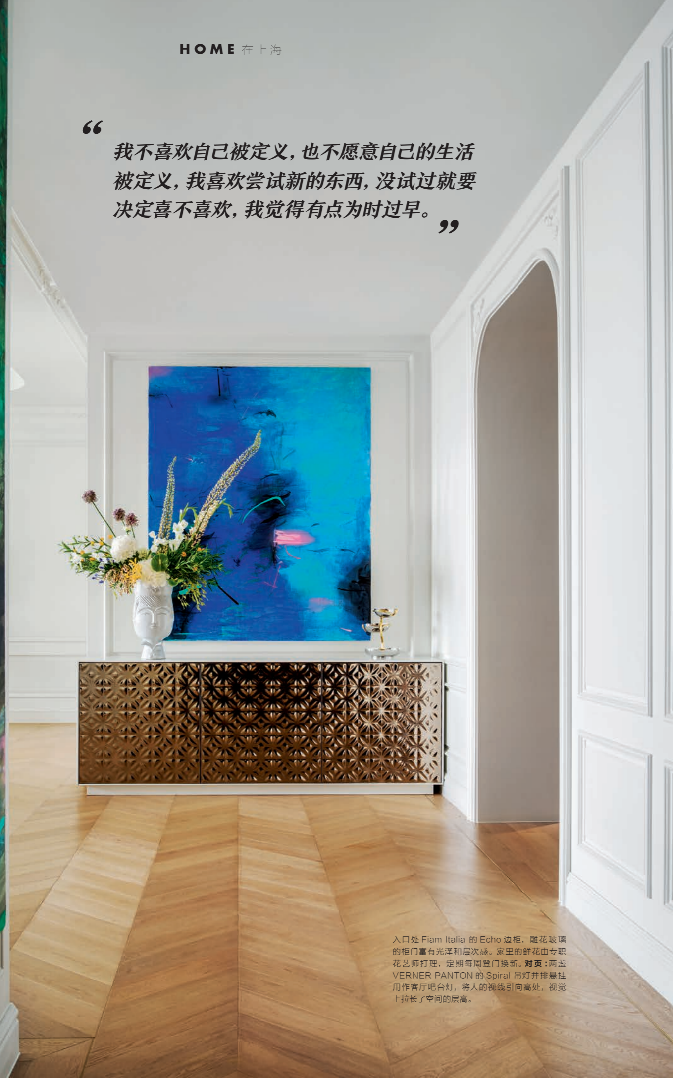
入口处 Fiam Italia 的 Echo 边柜，雕花玻璃的柜门富有光泽和层次感。家里的鲜花由专职花艺师打理，定期每周登门换新。对页：两盏 VERNER PANTON 的 Spiral 吊灯并排悬挂用作客厅吧台灯，将人的视线引向高处，视觉上拉长了空间的层高。

“我不喜欢自己被定义，也不愿意自己的生活被定义，我喜欢尝试新的东西，没试过就要决定喜不喜欢，我觉得有点为时过早。”