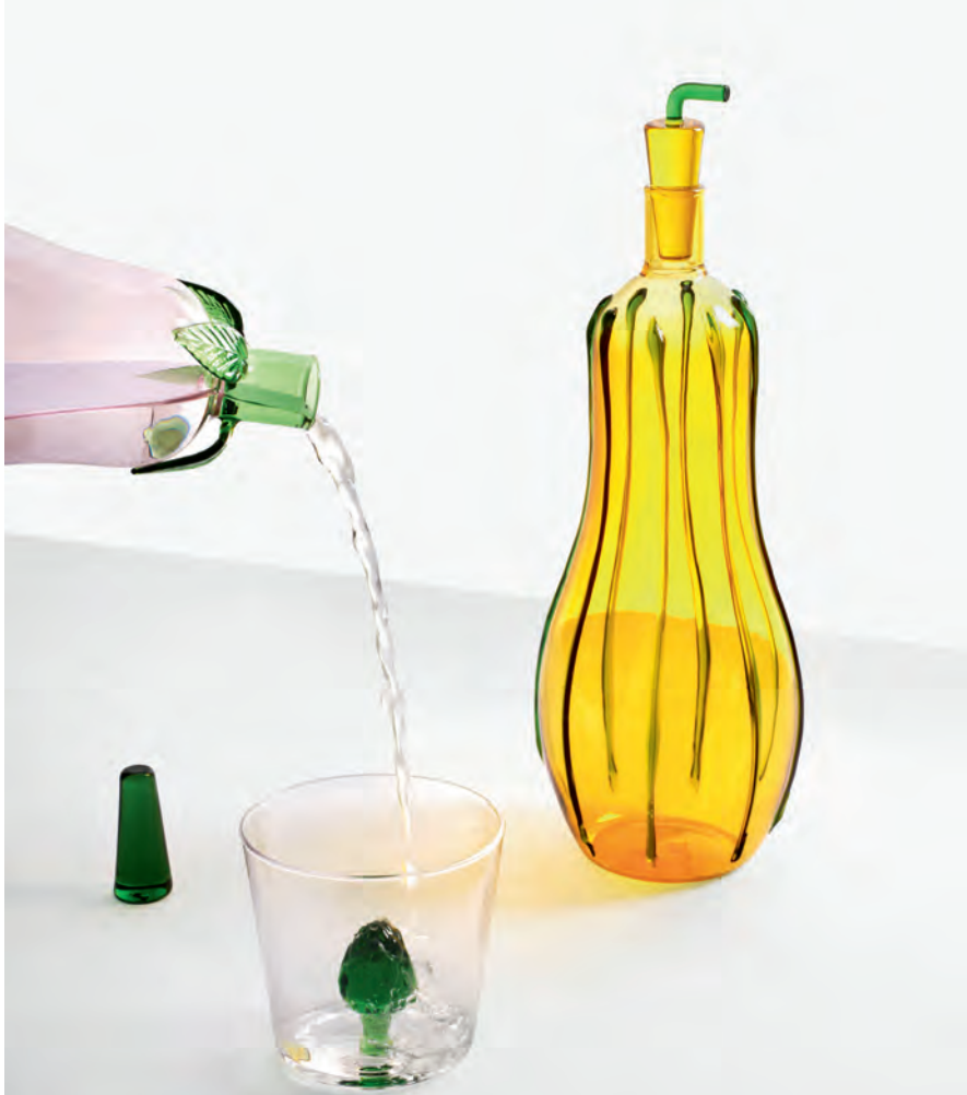
ICHENDORF发布全新饰品系列VEGETABLES

营业时间：周二至周六 10:00-19:00 地址：Via Visconti di Modrone 29, 米兰 www.porro.com