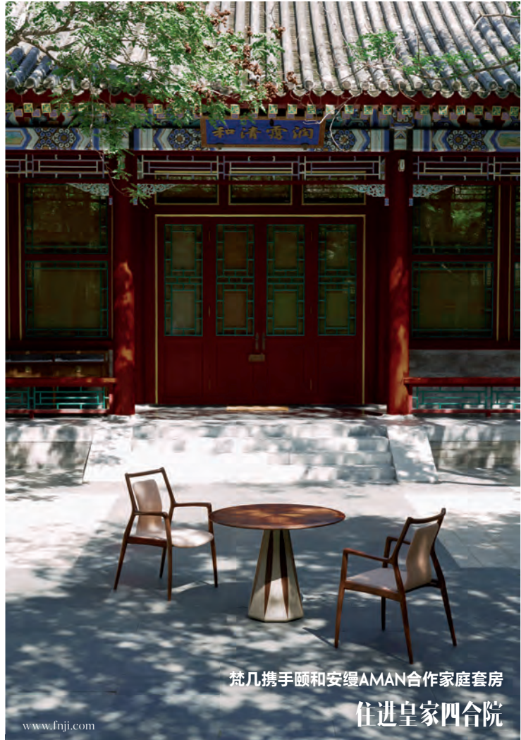
梵几携手颐和安缦AMAN合作家庭套房 住进皇家四合院

本次梵几与颐和安缦合作的套房以家庭房为主题，将梵几经典家具与FNJ kids儿童系列共同融入到这座百年院落内，为一家人带来舒适而放松的居住体验。信步于颐和安缦的回廊之间，恍惚间产生了时光交错之感——这座有着百年历史的四合院，其气度却从未随变迁消失，在喧嚣嘈杂的京城，辟出了一处静谧的“山水居所”。同样以“打造自然隽永的休憩所”为目标，梵几品牌基因中的“生野安室”与安缦灵魂中崇尚自然造化，关怀居客身心修养的初心有着天然的契合。