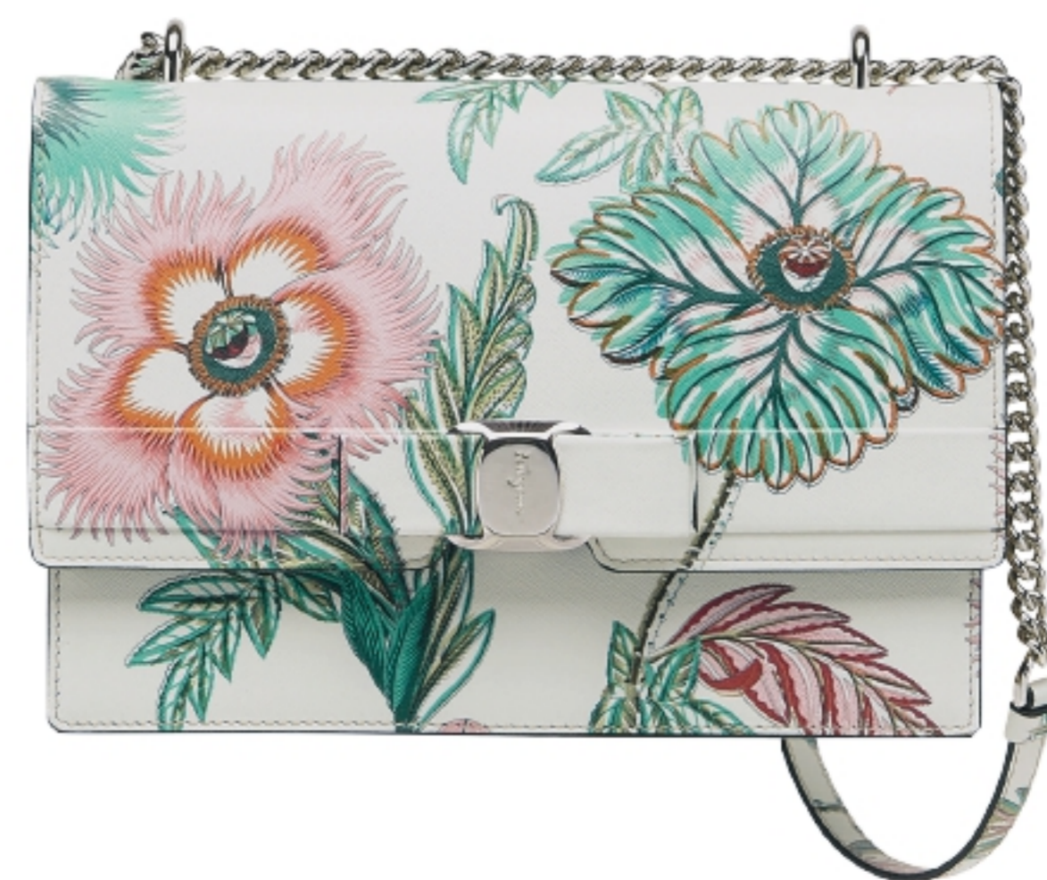
本页 11. Altana Collection 吊灯 Nathan Litera 约¥7500 12. 热带丛林板福宝 90厘米方巾 Hermes ¥3750 13. Cap Martin 椅子 India Mahdavi 价洽店内 14. MING MA 2021年春夏服装 15. GRANVILLE 格兰维尔系列花瓶 Dior 价洽店内 16. Cuckoo 钟 Giorgetti ¥31300 17. Henrietta 发箍 Shrimps ¥1400 18. Shamadar 烛台 Gallery All ¥3744 19. VARA 蝴蝶结挎包 Ferragamo ¥14950 20. West 台灯 Calyer Ceramics 约¥8400