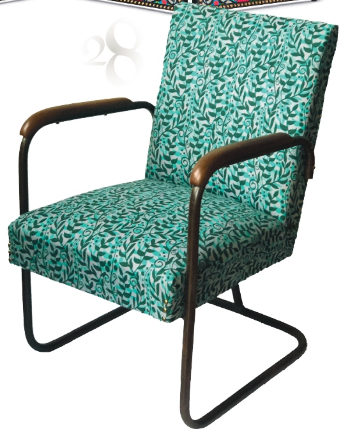
本页 21. Square Buckle Floral腰带 Carolina Herrera 约¥4500 22. Swamp Drain吊灯 Objective 价洽店内 23. 红宝石 & 钻石雏菊耳环 Yji ¥17050 24. Meltingpot桌 Dirk Vander Kooij ¥47600 25. Swirl Stem花瓶 Tom Dixon ¥3040 26. 牛年纸镇 Saint-Louis 圣路易水晶 ¥36050 27. 饰花卉和蜜蜂图案四面式屏风 Gucci ¥255000 28. 复古中式扶手椅 CHINOISES ¥3600 29. Bishop "Apple Blossom" India Mahdavi 价洽店内 30. Rue Agthonis 2021年春夏服装